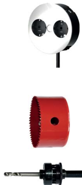
podobne do rysunku